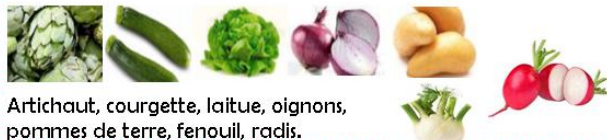
Artichaut, courgette, laitue, oignons, pommes de terre, fenouil, radis.