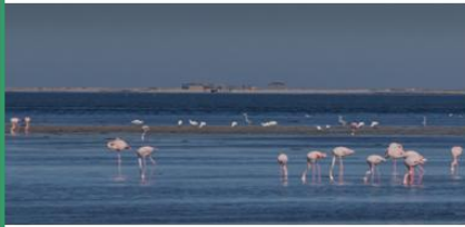
Photo de flamants roses de Djerba

Le flamant est un grand oiseau de la famille des échassiers, qui a la particularité d'arborer un plumage rose.